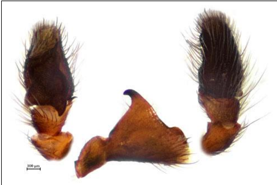
Abb. 5: Heliophanus patagiatus , Männchen, linker Pedipalpus Fig. 5: Heliophanus patagiatus , male, left palp