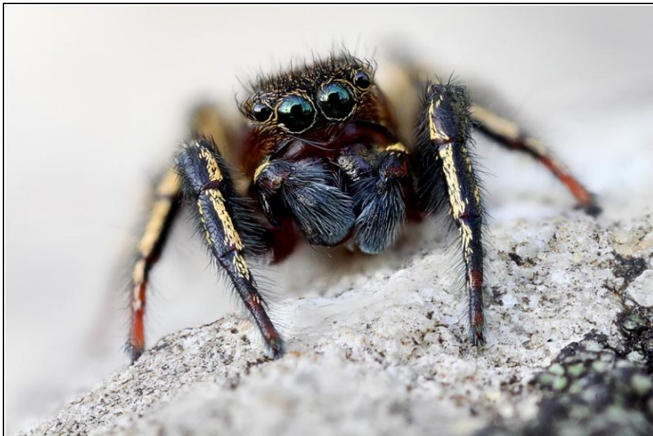
Abb. 3: Heliophanus patagiatus , Männchen, Frontalansicht Fig. 3: Heliophanus patagiatus , male, frontal view