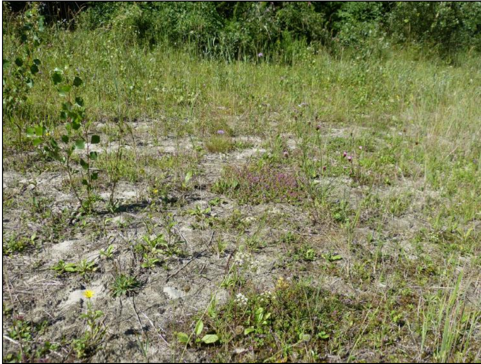
Abb. 2: Detailansicht vom Fundort Fig. 2: Detailed view of the locality