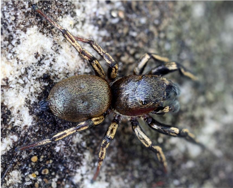
Abb. 4: Heliophanus patagiatus , Männchen, Dorsalansicht Fig. 4: Heliophanus patagiatus , male, dorsal view