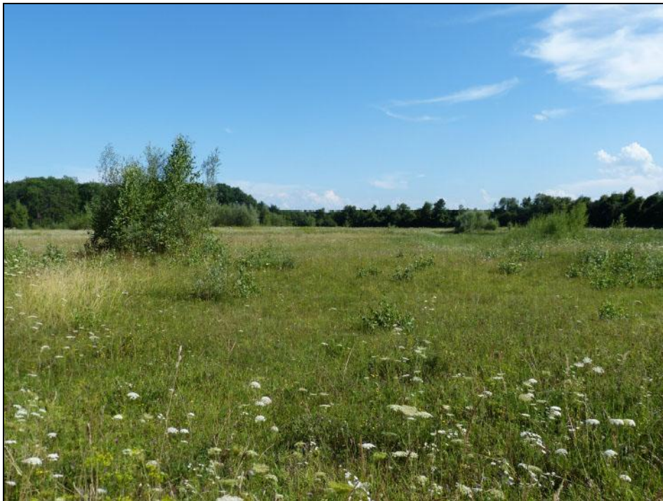
Abb. 1: Fundort von Heliophanus patagiatus Fig. 1: Locality of Heliophanus patagiatus

ten Boden bis zum Kies, teilweise bis zum Grundwasser, ab. Mit Mähgutübertragung von intakten Terrassenkanten und jährlicher Mahd wurde die Fläche renaturiert und ihre ursprüngliche Brennenstruktur wieder hergestellt. So entstand der Biotopkomplex, genannt "Biotopacker bei Eglsee" (Abb. 1), der aus Sukzessionsflächen unterschiedlicher Entwicklungsstadien von offenen Kiesböden über spärlich bewachsene Magerrasen (Abb. 2) bis zu grundwassernahen Standorten besteht (SAGE et al. 2010).